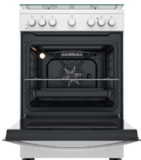
TABLE DE CUISSON