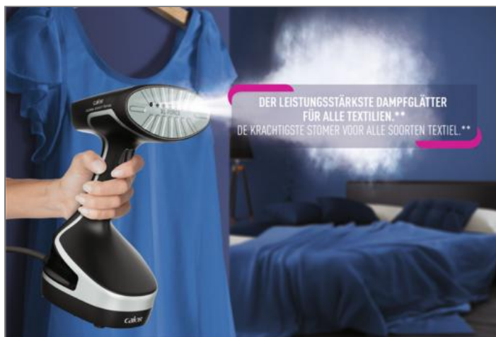
ACCESS STEAM FORCE DT8230C0