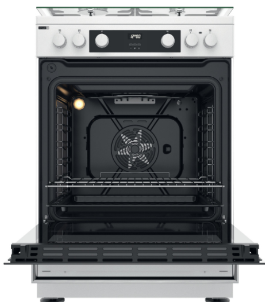
TABLE DE CUISSON