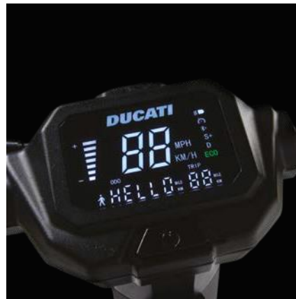
Écran large LED de 3.5"