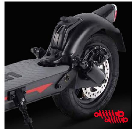
Suspension avant et arrière