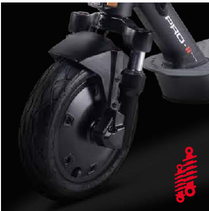
Pneus 10" tubeless